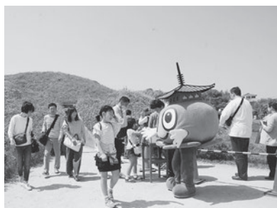
▲ 昨年度の史跡藤ノ木古墳 春季石室特別公開のようす