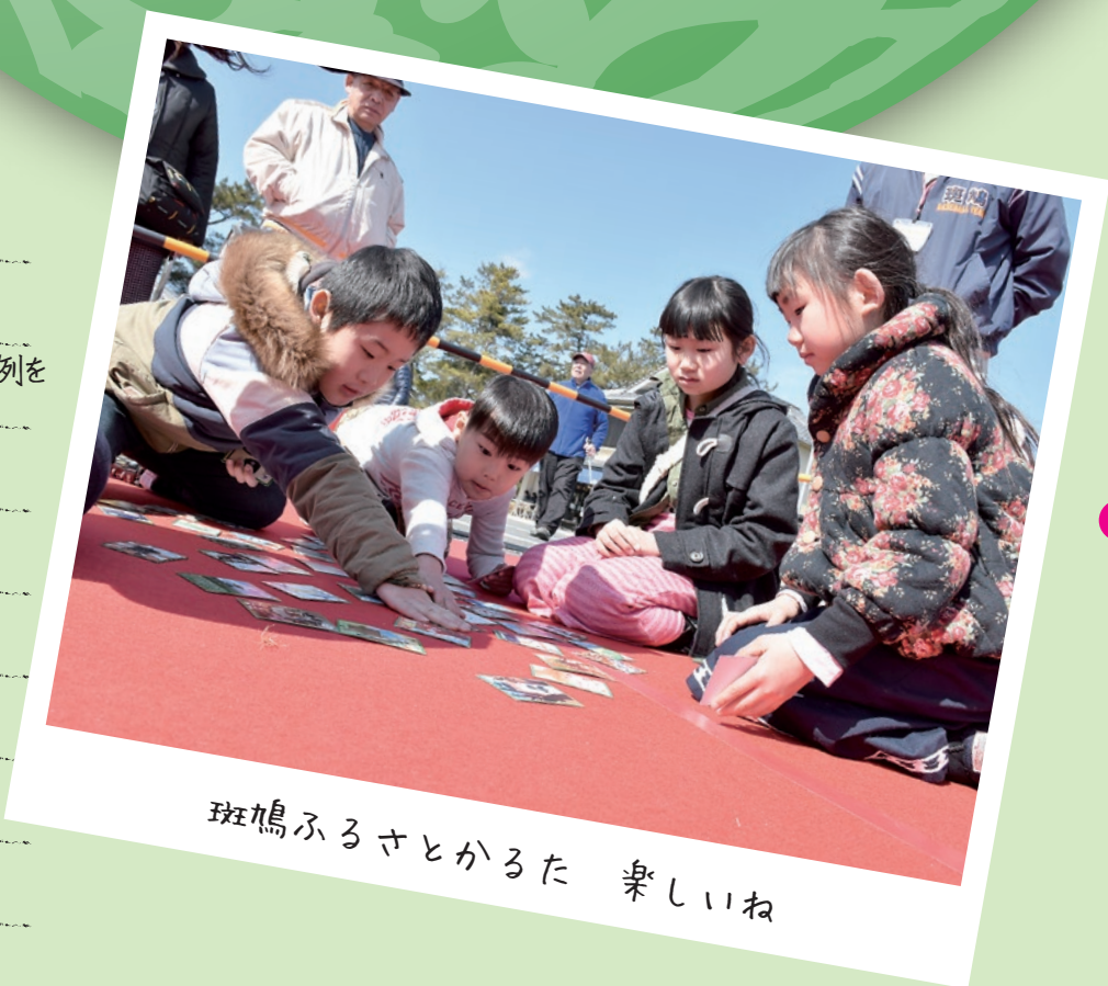
斑鳩ふるさとかるた 楽しいね