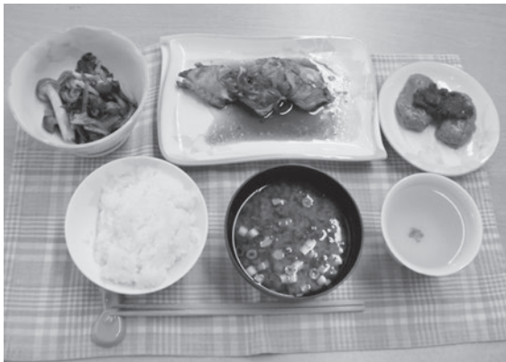
▲できあがりしました！

また、「お会式」だけでなく、斑鳩の風習にまつわるお話も紹介し、参加者のみなさんは、斑鳩の食生活に関する歴史について、知識を深めました。