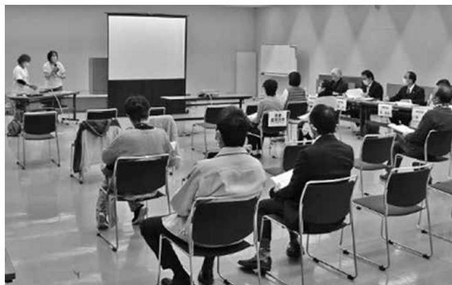
▲ 公開プレゼンテーションのようす

「つくる暮らしの会」は、昔は日常にあった、つくる暮らしを実践し、その記録をSNS等で発信しています。2年目の活動として、「つくる暮らし」を通してまちとつながり、地域コミュニティの活性化を図ります。