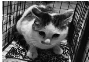
▲ TNRを施した猫ちゃん

町内の飼い主がいない猫を増やさないために、TNR活動(捕獲、不妊手術、リリース)を実施しています。この活動を小中学校での出前授業を通して周知し、子どもたちに生き物の命の大切さと生態系の仕組みを学ぶ機会をつくります。