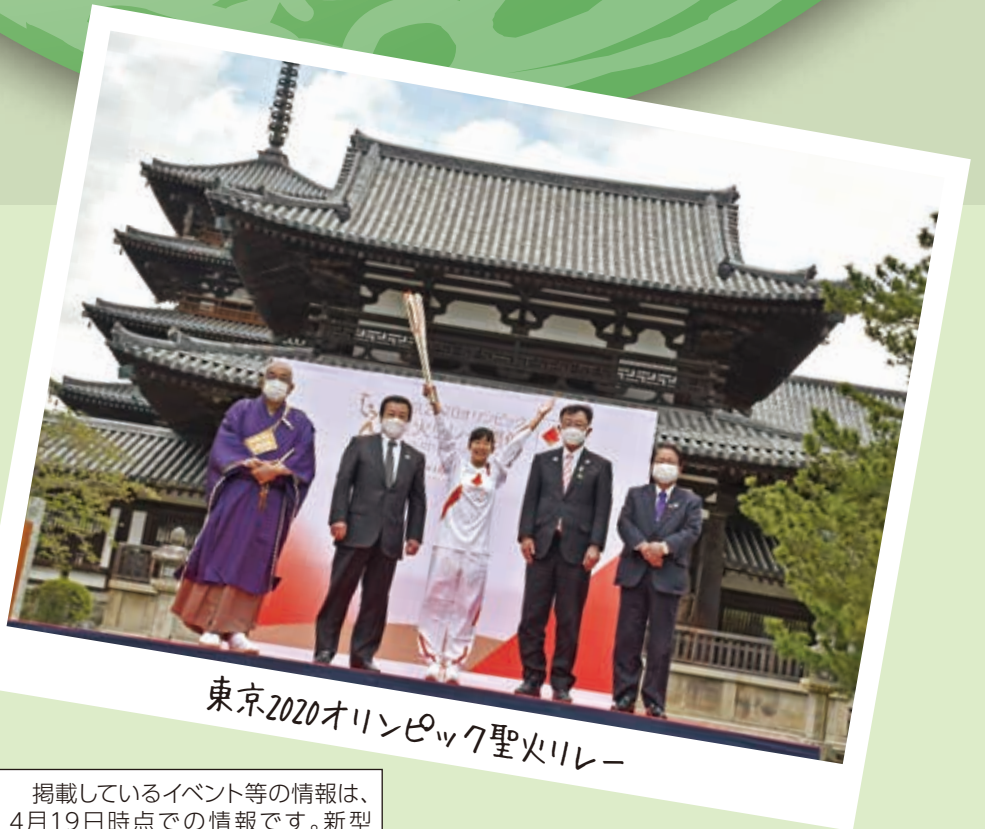
東京2020オリンピック聖火リレー

掲載しているイベント等の情報は、4月19日時点での情報です。新型コロナウイルス感染症の影響に伴う最新情報は、町ホームページをご確認いただくか、担当課へお問い合わせください。