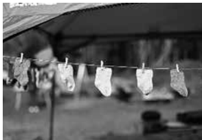
▲ 草木染めのベビーソックス

町内で収穫したものや手作り品を地域で共有する場所や機会をつくり、作り手と住民との交流、地域コミュニティの活性化、にぎわいづくりをめざします。「つくる暮らし」を通して、斑鳩で暮らす素晴らしさを広めます。