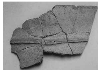
▲ 中宮寺跡出土の埴輪片

そのほかの例として、宅地造成工事に伴い発掘調査が実施された竜田守谷古墳（龍田北2丁目）は、すでに埋葬施設である横穴式石室はかなりの破壊を受けていましたが、6世紀後半頃の須恵器が出土しました。