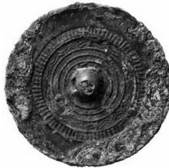
▲ 甲塚古墳出土の「重圏文鏡」

今月号では、昨春、新型コロナウイルスの感染拡大防止のため開催を延期していた、春季企画展「知られざる斑鳩の古墳 —斑鳩の古墳展②—」を、5月22日(土)～6月27日(日)に開催することになりましたので、あらためて展示内容について紹介します。