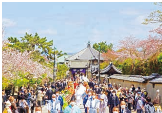
▲ 東院伽藍から西院伽藍へと向かう行列

聖徳太子が622年にお亡くなりになってから今年で1400回忌を迎え、法隆寺では、聖徳太子の遺徳を偲ぶため、「聖徳太子1400年御聖諱法要」が4月3～5日にかけて行われました。