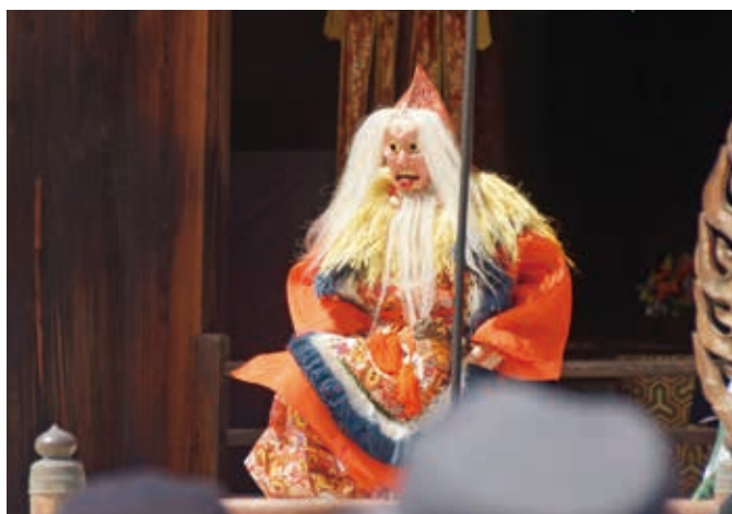
▲ 山の神が喜悅して舞う姿を表現した舞楽「蘇莫者」