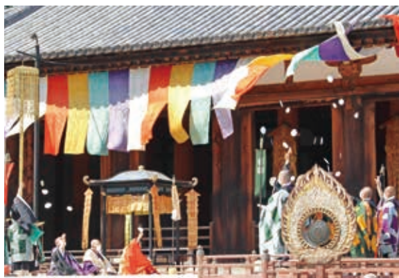
▲ 声明を唱え散華をまくようす

多くの参拝者が見守る中、西院伽藍では、僧侶や御輿の行列、南都楽所による舞楽の奉納などが行われ、厳かな雰囲気にも包まれた3日間となりました。