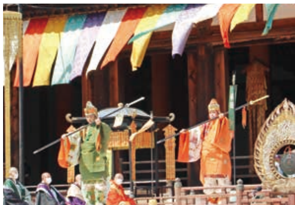
▲ 舞台を清めるために行われる「振鉾三節」