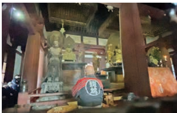
▶ 訓練前に行われた「金堂壁画焼損自粛法要」