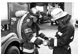
筒先の取扱いの確認