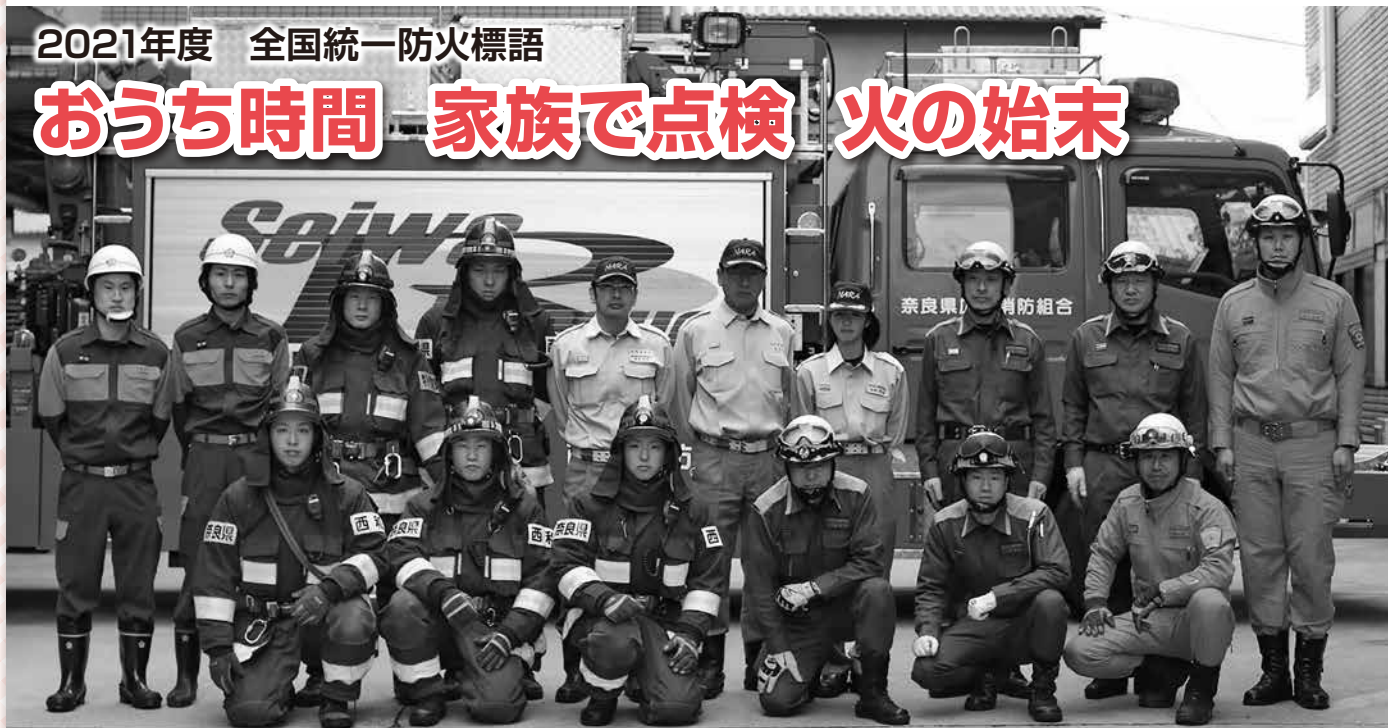
奈良県広域消防組合西和消防署・斑鳩町消防団の機械操作研修にて