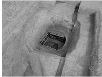
▲井戸と思われるような遺構の完掘状況