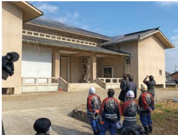
▲焼損した壁画を保存する収蔵庫での防火訓練

新型コロナウイルス感染症の感染拡大に伴い、昨年に続き消防車両を用いた放水訓練は中止となりましたが、法隆寺自衛消防団・斑鳩町消防団など約50人が参加し、文化財の大切さを再認識し、気持ちを引き締めました。