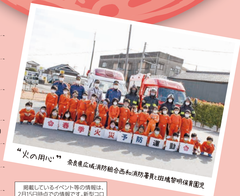
“火の用心” 奈良県広域消防組合西和消防署員と斑鳩黎明保育園児

掲載しているイベント等の情報は、 2月15日時点での情報です。新型コロナ ウイルス感染症の拡大状況により 中止する場合があります。