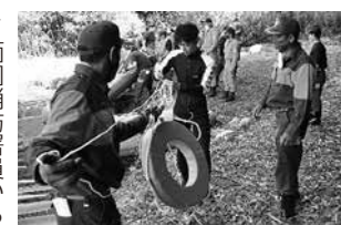
西和消防署員から浮き輪の取扱いの指導を受ける団員

集中消火となる場合、お互いの現場指揮官が連携し合い、効果的な消火活動を実施することが必要であると考えています。住民にとっては、消防職員と消防団員であるかは関係ないのですから…。