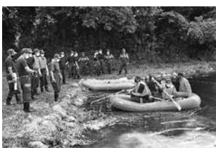
水難事故を想定した救助訓練