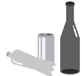
屋外に放置された空きビン・缶・ペットボトル