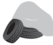
雨よけのブルーシートや古タイヤに溜まった水たまり