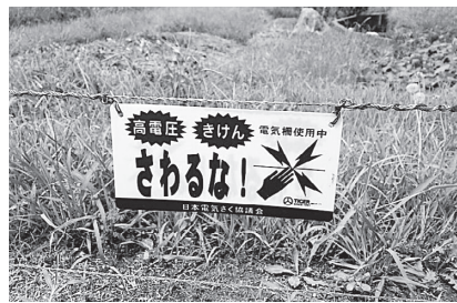
※農作物をイノシシから守るための電気柵です。絶対に触れないでください。

• 昨年度からイノシシによる農作物への被害を防止するため、電気柵などの資材費および設置費に対して、その費用の一部を補助しています。補助率は電気柵、その他防護柵などの資材費および設置費の2分の1以内（限度額は10万円）です。 ※詳しくは、観光産業課へお問い合わせください。