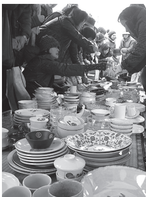
▼とうき(陶器)市のように