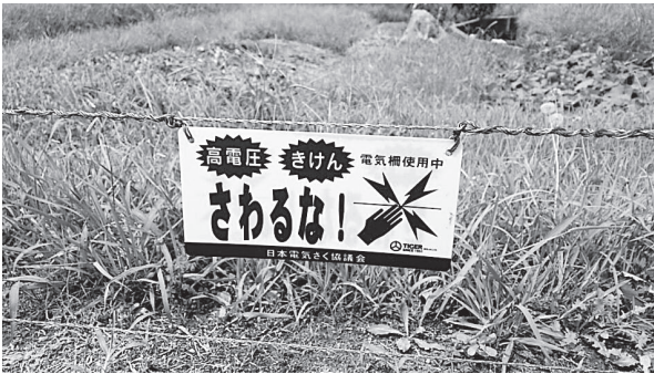
※農作物をイノシシから守るための電気柵です。絶対に触れないでください。