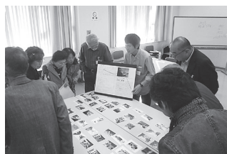
▲前回ワークショップの様子