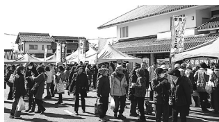
▲ 昨年(斑鳩市)のようす