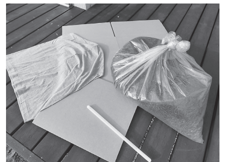
▲ダンボールコンポストセット