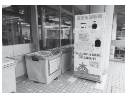
▲資源にカエル宝箱

【設置場所】 役場、中央・東・西公民館、生き生きプラザ斑鳩のペットボトル・トレイ回収ボックス付近