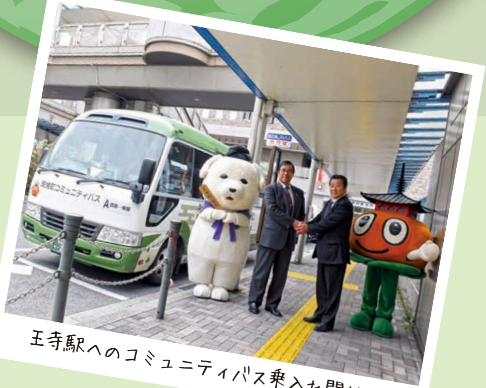
王寺駅へのコミュニティバス乗入れ開始!

掲載しているイベント等の情報は、4月17日時点での情報です。新型コロナウイルス感染症の影響に伴う最新情報は、町ホームページをご確認いただくか、担当課へお問い合わせください。