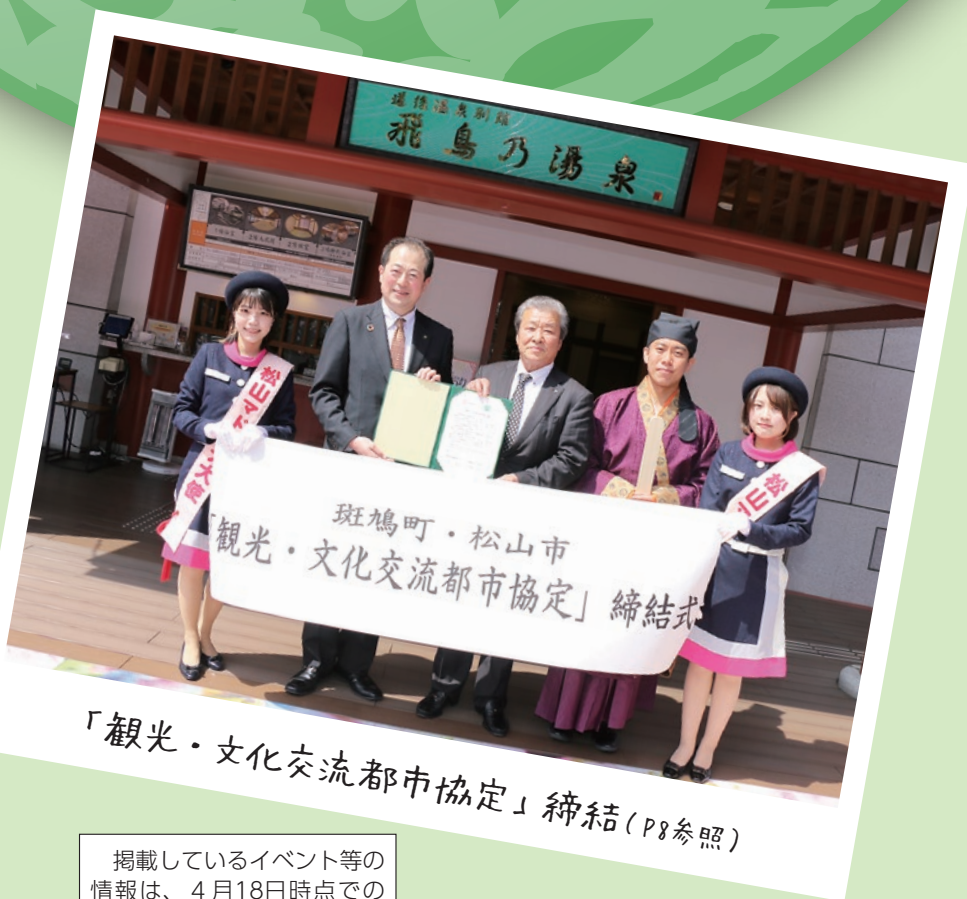
「観光・文化交流都市協定」締結(P8参照)

掲載しているイベント等の情報は、4月18日時点での情報です。新型コロナウイルス感染症の拡大状況により中止する場合があります。