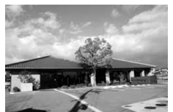
斑鳩町文化財活用センター

イレは足腰の弱い高齢者には使いにくいいため、洋式トイレの増設を求められているものであります。