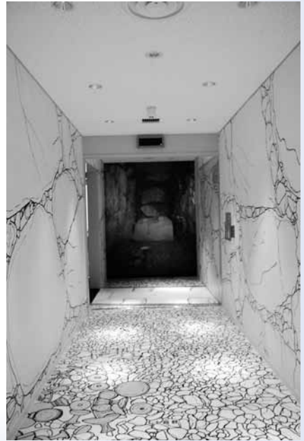
◀ 通路は、石室のなかを歩いているようなイメージ