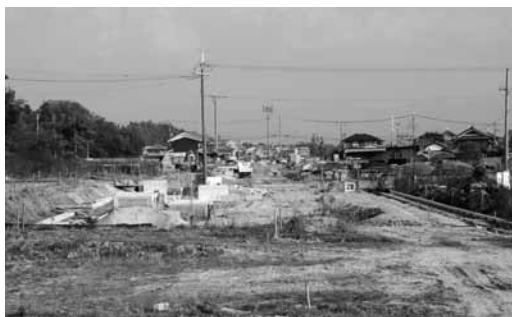
いかるがパークウェイ(稲葉車瀬区間)の工事

議員 今現在工事が進んでき ている、いかるがパークウェ イに対し、住民の関心が高い 現状を踏まえ、正確な情報を 伝えるということに努力して いただくことを要望します。