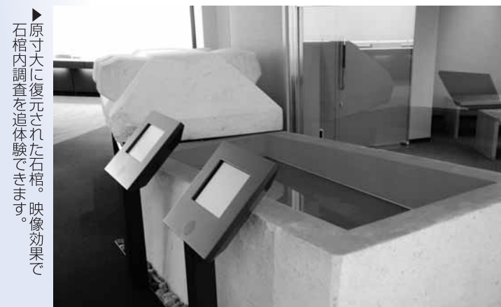
▶ 原寸大に復元された石棺。映像効果で 石棺内調査を体験できます。