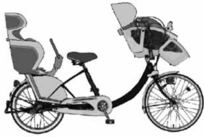
幼児二人同乗用自転車