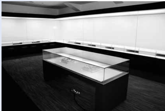
◀ 国宝も展示できる エアタイトケース (密閉式展示ケース)

平成22年3月20日、法隆寺西1丁目に、斑鳩町文化財活用センター(愛称：斑鳩文化財センター)がオープンする予定です。