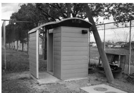
斑鳩南中学校サブグラウンドのトイレ