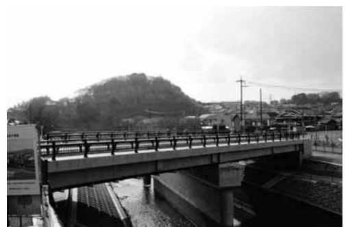
いかるがパークウェイの岩瀬橋工事