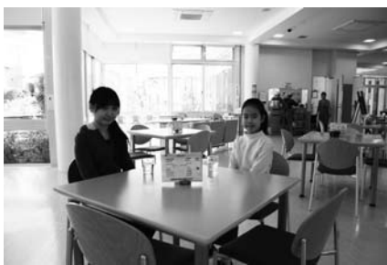
▲生き生きプラザ斑鳩の喫茶コーナー