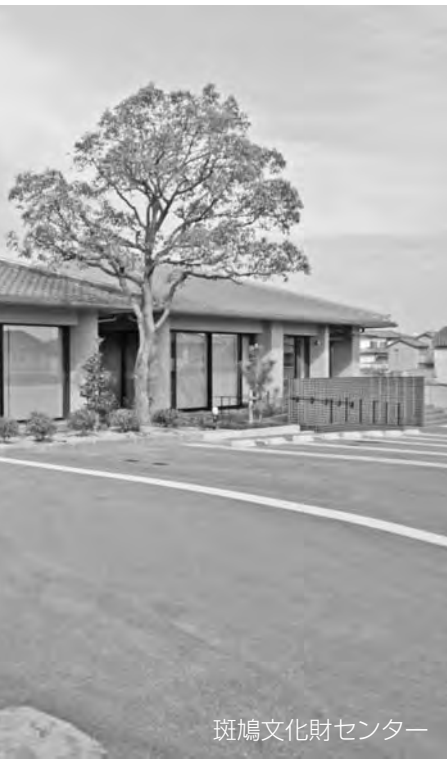
斑鳩文化財センター