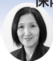
里川 宜志子 議員