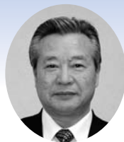
飯 高 昭 二 議員

変の発生をほぼ完全に予防する効果があることは認識していますが、すべての発がん性ウイルスに効果がみられるわけではない等の問題点も指摘されています。今後、現状を踏まえ調査研究を行います。