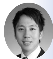
小林 誠 議員