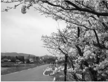
▲「地域活性化・きめ細かな交付金」を活用して整備される町道437号線

・道路新設改良事業を「地域活性化・きめ細かな臨時交付金」を活用して整備される町道437号線