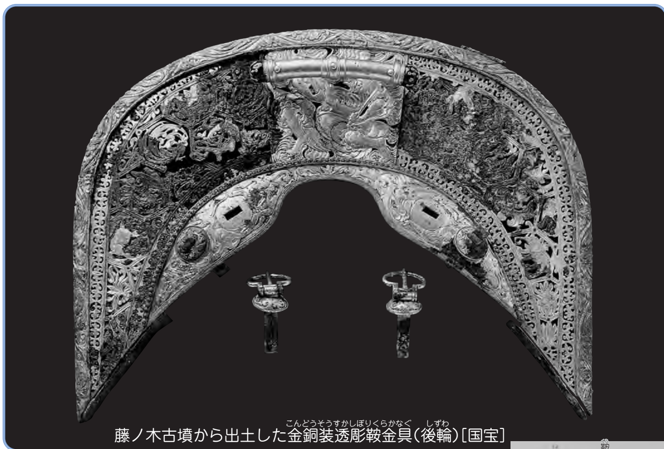
藤ノ木古墳から出土した金銅装透彫鞍金具(後輪) [国宝] こんどうそうすかしほりくらかなく しずわ