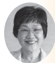
奥村 容子 議員