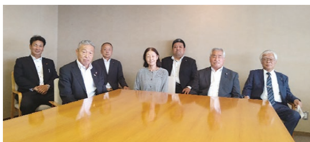
▲令和4年度の広報発行常任委員会委員