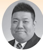
大森 恒太郎 議員

議員 町民プールは令和2年度3年度運営していましたが、現状はどうですか。 教育次長 令和2年度3年度は新型コロナウイルスの影響により運営していません。