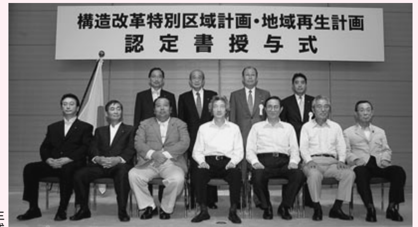
7月19日地域再生計画認定書授与式

斑鳩町では、愛すべきふるさと「新斑鳩の里」を未来に引き継ぐことをテーマに、住民と連携しながら、環境共生型のまちづくりをすすめていきます。そのため、この交付金により、公共下水道事業と浄化槽設置整備事業を円滑にすすめる、汚水処理施設の普及促進をおこないます。