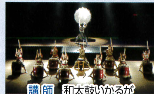
講師 和太鼓いかるが

日本の伝統楽器、和太鼓。講座ではまず古タイヤを使って基本となる打法を学び、太鼓を打つ楽しさや爽快感を体感いただけます。この機会に和太鼓の魅力を体験してみませんか。