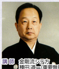
講師 金剛流シテ方 種田道三(重要無形文化財保持者)

金剛流発祥の地である斑鳩で、日本の伝統芸能を代表する「能」の鑑賞の楽しみ方だけではなく、謡と仕舞を基本から実践的に学んでいただけます。奥深い幽玄の世界をぜひご体験ください。