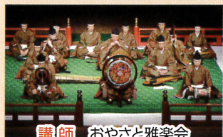
講師 おやさど雅楽会

アジア大陸各地を源流とする伝来楽舞が日本の楽舞との融合を経て平安時代に完成した雅楽。講座では雅楽の歴史を学び楽器を演奏いただきます。一緒に「世界最古のオーケストラ」を奏でてみませんか。