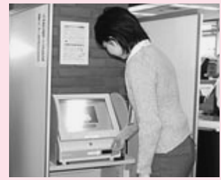
自宅のパソコンから行政機関へ申請や届出ができる仕組みづくりをすすめます。