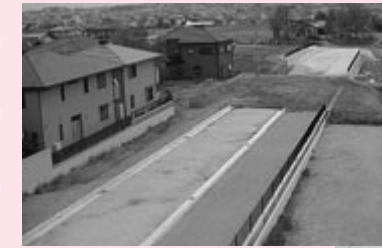
整備がすすむ都市計画道路法隆寺線