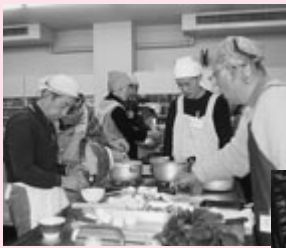
高齢者の自立支援のための教室（男の料理教室）を開きます。