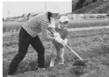
▲ 昨年のそば栽培のようす