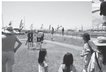
▲ ◀ 昨年ようす