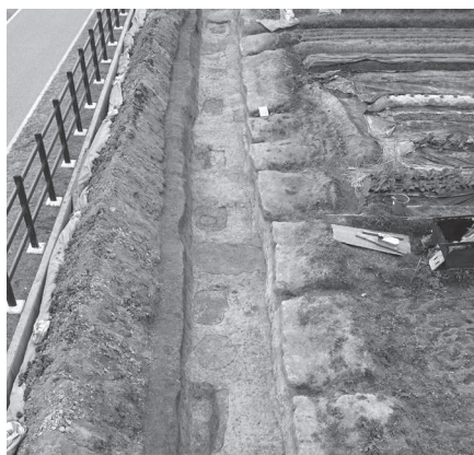
▲北限と考えられる柱列

発掘調査の結果、調査区の西端から東端までの間で、東西方向に並んだ柱穴が23個見つかりました。