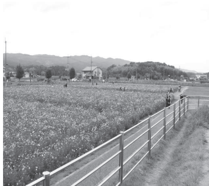
▲史跡中宮寺跡歴史公園の金堂基壇から北西方向を望む