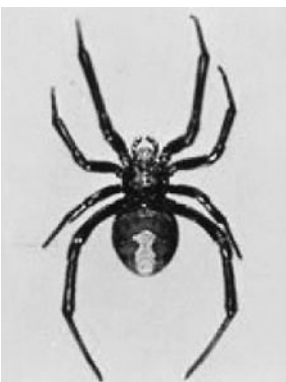
町内でも 見つかっています!

万一かまれたときは、できるだけ早く病院行って治療を受けてください。病院にクモを持参すると、適切な治療につながります。