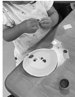
▲末就園のお子さんに、季節にあわせた活動を提供する「ぷち保育室」