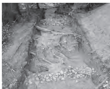
▲古墳の墳丘に葺かれた「葺石」