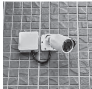
▲家庭用防犯カメラ

がそのお宅に赴き、捜査上の許可を取った上で、映像データの提供を受けていただくことを想定しています。近隣の同意等については、近隣の方に設置をする旨のお声がけをしていただく程度で検討しています。