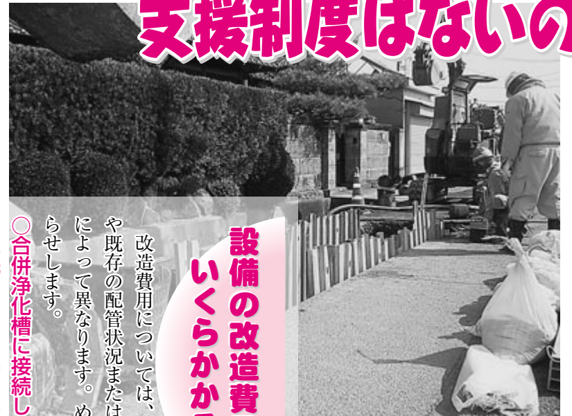
▲下水道工事のようす