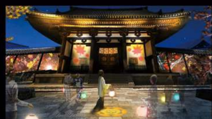
プロジェクションマッピング